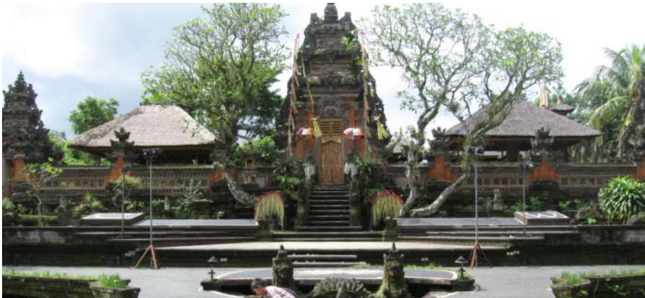
Nuit au Waka Di Ume.

Excursion jusqu'au village de Kintamani, d'où l'on découvre le plus grandiose panorama de Bali; le volcan Batur et sa caldeira de 12 kilomètres de circonférence, dont le fond est occupé par un immense champ de lave entourant le lac Batur. Possibilité de faire le tour du volcan en descendant dans le cratère. Vous pourrez redescendre ensuite en direction de l'est au pied du Mont Agung. Le temple de Besakih, temple - mère des Balinais, y est adossé. C'est le lieu le plus vénéré de l'île, considéré comme sacré depuis la préhistoire. Le volcan Agung, la «montagne-mère» de Bali, qui culmine sur la moitié orientale de l'île, est l'une des plus belles régions de l'île: de brusques plissements de collines veloutées vers le sud, d'arides étendues rocheuses vers le nord. La majorité de la population occupe les fertiles vallées du sud, où se trouvent de très anciens villages.