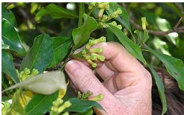
Nuit au Fundu Lagoon.

Située à environ 80 kilomètres au nord de Zanzibar, Pemba est la deuxième plus grande île de l'archipel. Elle est pourvue de nombreuses collines aux terres fertiles et à la végétation dense. Les omanais l'appelaient «The Green Island». La grande majorité de la production de clous de girofle se fait sur cette île.