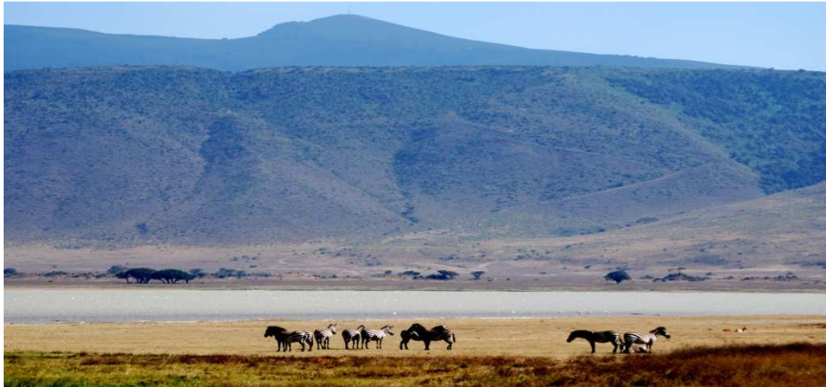
Nuit au Plantation Lodge.